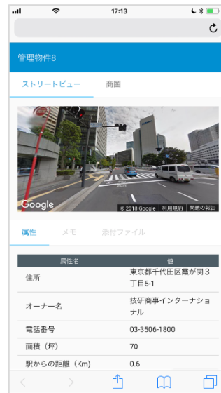
【物件調査内容の登録・共有】

出店候補地を現地調査した結果をその場で登録・閲覧。すばやく、簡単に物件情報の共有が可能。