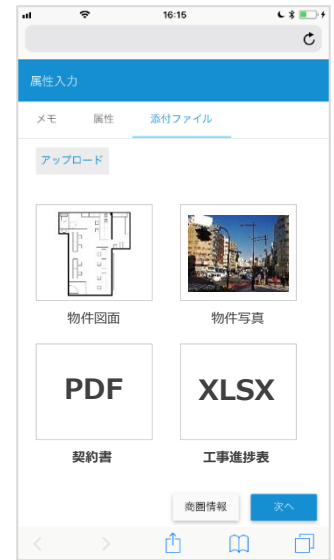
【データ・ファイルの登録・共有】

出店候補地を現地調査した結果をその場で登録・閲覧。すばやく、簡単に物件情報の共有が可能。